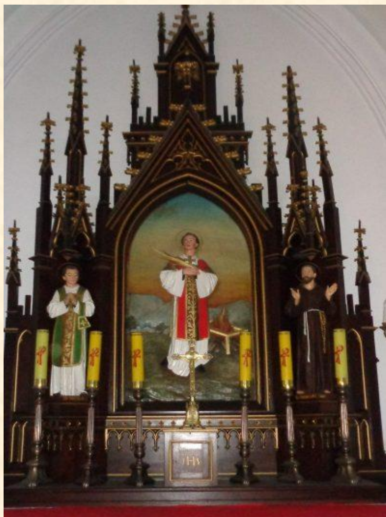
Obraz św. Wawrzyńca w kościele pod jego wezwaniem w Kutnie