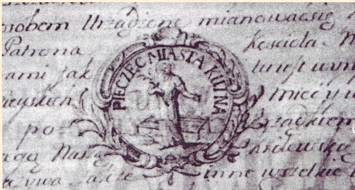
Wzór pieczęci miejskiej z przywileju lokacyjnego z 1766 roku

W tekst dokumentu wpisany jest wzór tej pieczęci. Przedstawia on postać męczennika z liściem palmowym w prawej dłoni, jako symbolem zwycięstwa. W tle za postacią znajduje się krata – miejsce kaźni św. Wawrzyńca umęczonego na rozpalonych ogniach. Całość opleciona jest ozdobnym wieńcem. Na polu pieczętnym ulokowany został napis: PIECZĘĆ MIASTA KUTNA.