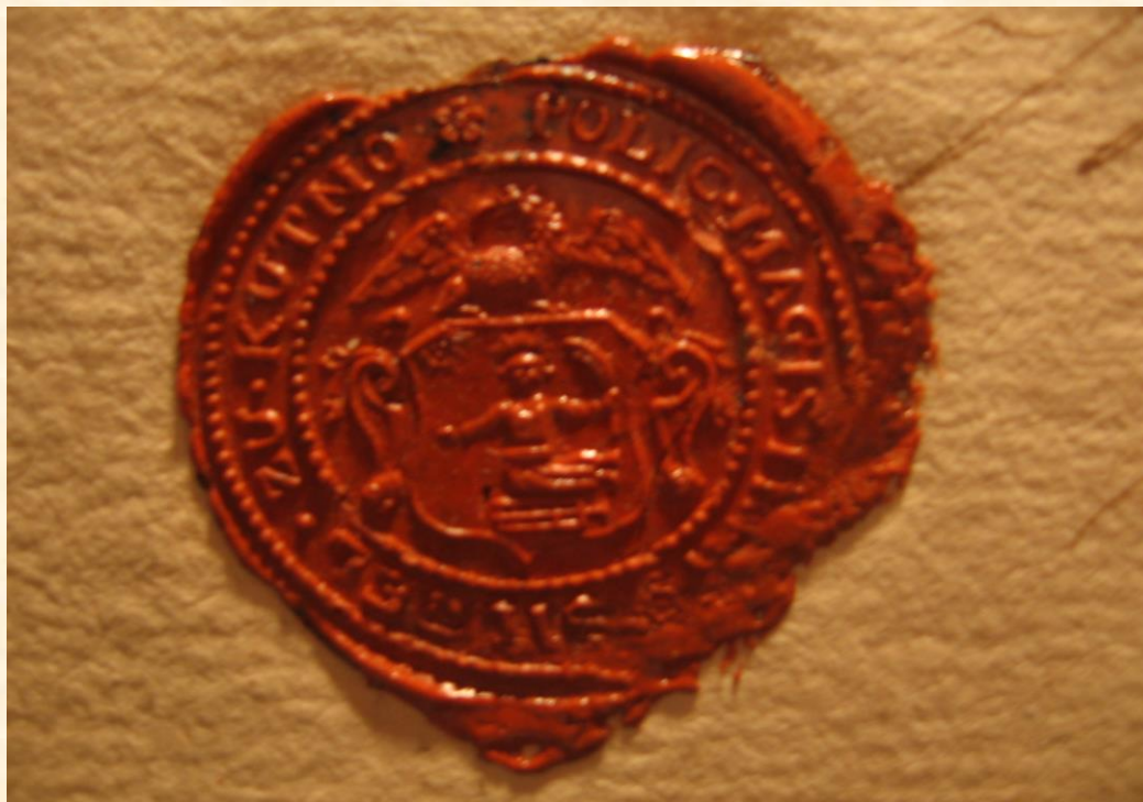
Pieczęć magistratu kutnowskiego z czasów pruskich (APK, Akta miasta Kutna sygn. 16)

Druga zachowana pieczęć magistracka, także odcisk w czerwonym wosku, o średnicy 35 mm różni się od poprzednich głównie legendą 9 . Stosowana była bowiem przez władze miejskie w związku je kompetencjami sądowymi, wyraźnie też określa przynależność Kutna do Prus Południowych.