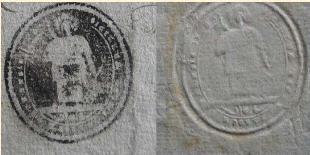
Pieczęć parafii pod wezwaniem św. Wawrzyńca w Kutnie z 1810 r. (odciski wykonane w tuszu i przez papier) APK, Akta Sądu Pokoju w Kutnie, sygn. 20