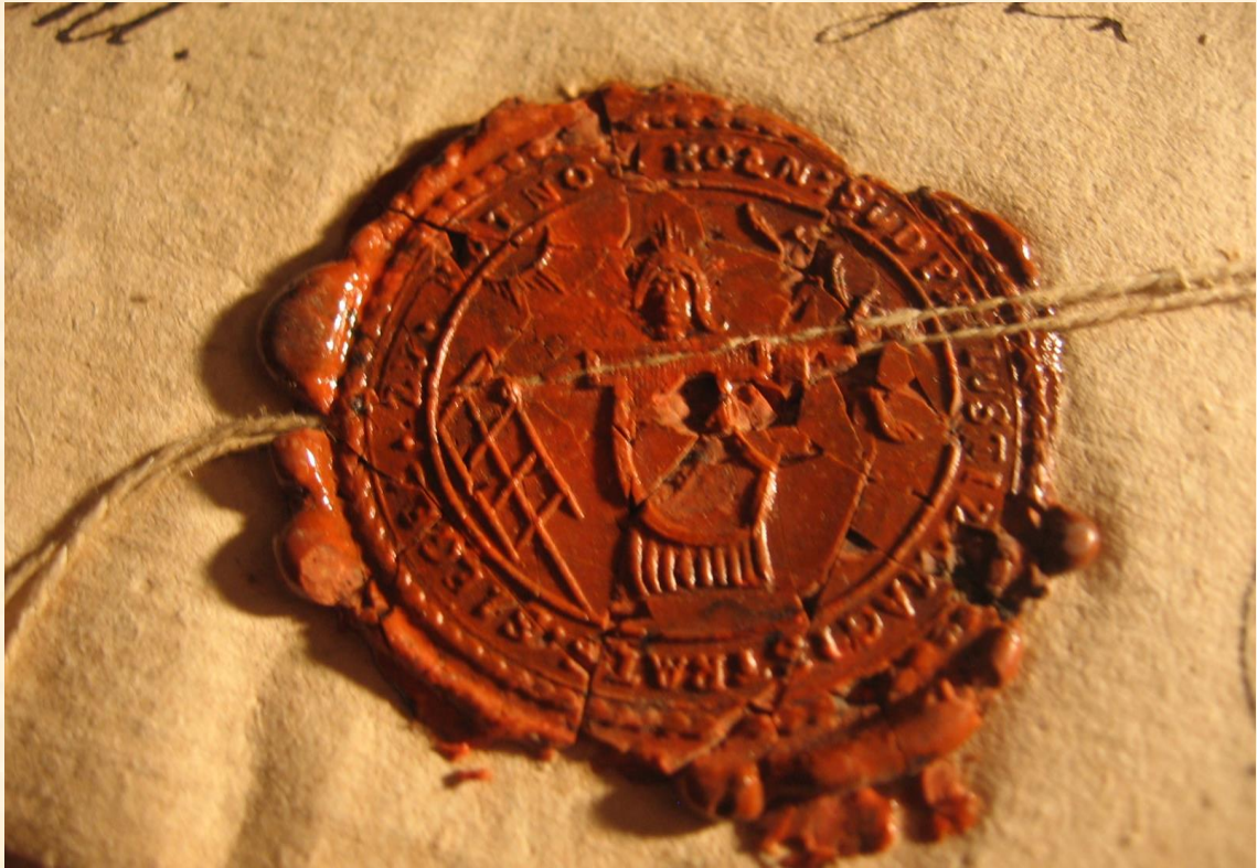
Pieczęć magistratu Kutna, przełom XVIII/XIX w., ( APK, Hipoteka w Kutnie. sygn. 2519)

Pieczęć miasta w okresie Księstwa Warszawskiego od 1807 do 1811 roku zachowała wszystkie zasadnicze atrybuty poprzednich. W związku z kolejną zmianą przynależności państwowej i zmianą ustrojową zmieniała się legenda pieczęci, a jej rysunek został wzbogacony o nowy element. Widoczne jest to w zachowanym odcisku z 1810 roku 10 .